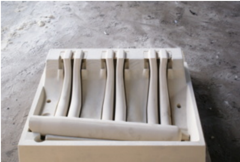
Ansaugkrümmer Mercedes SL Bj. 1953